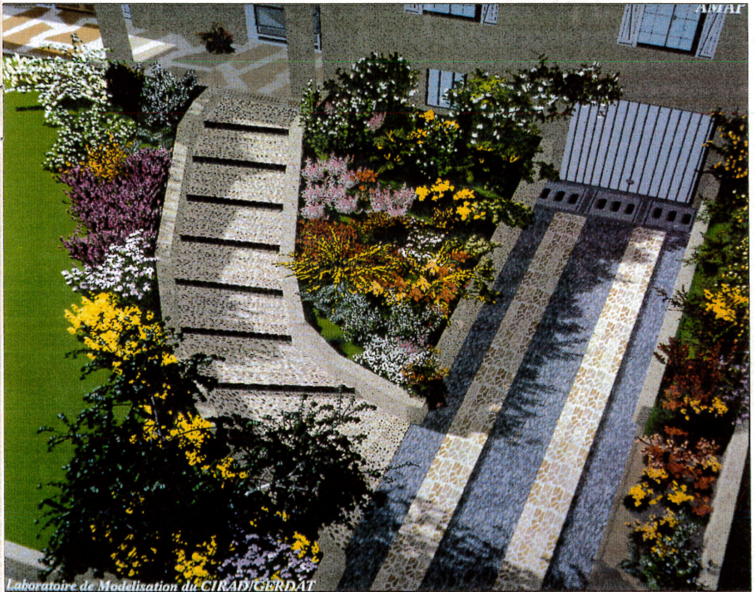
Laboratoire de Modélisation du CIRAD/GERDAT

feuillage persistant, luisant. Fleurs blanc crème, très parfumées, apparaissant de janvier à mars.